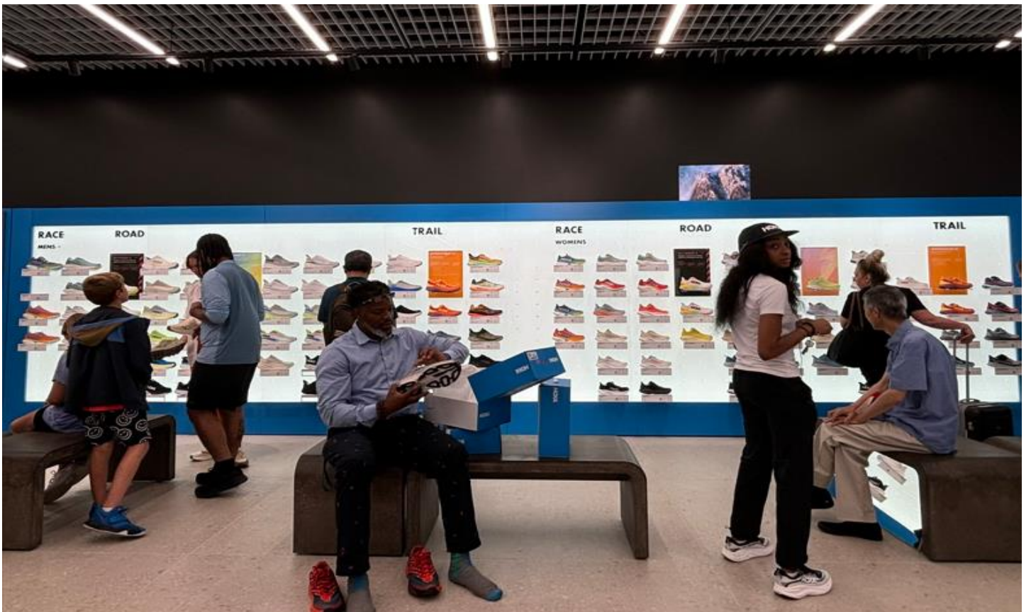
本格派からファッション派までの心を掴むスニーカーラインナップ