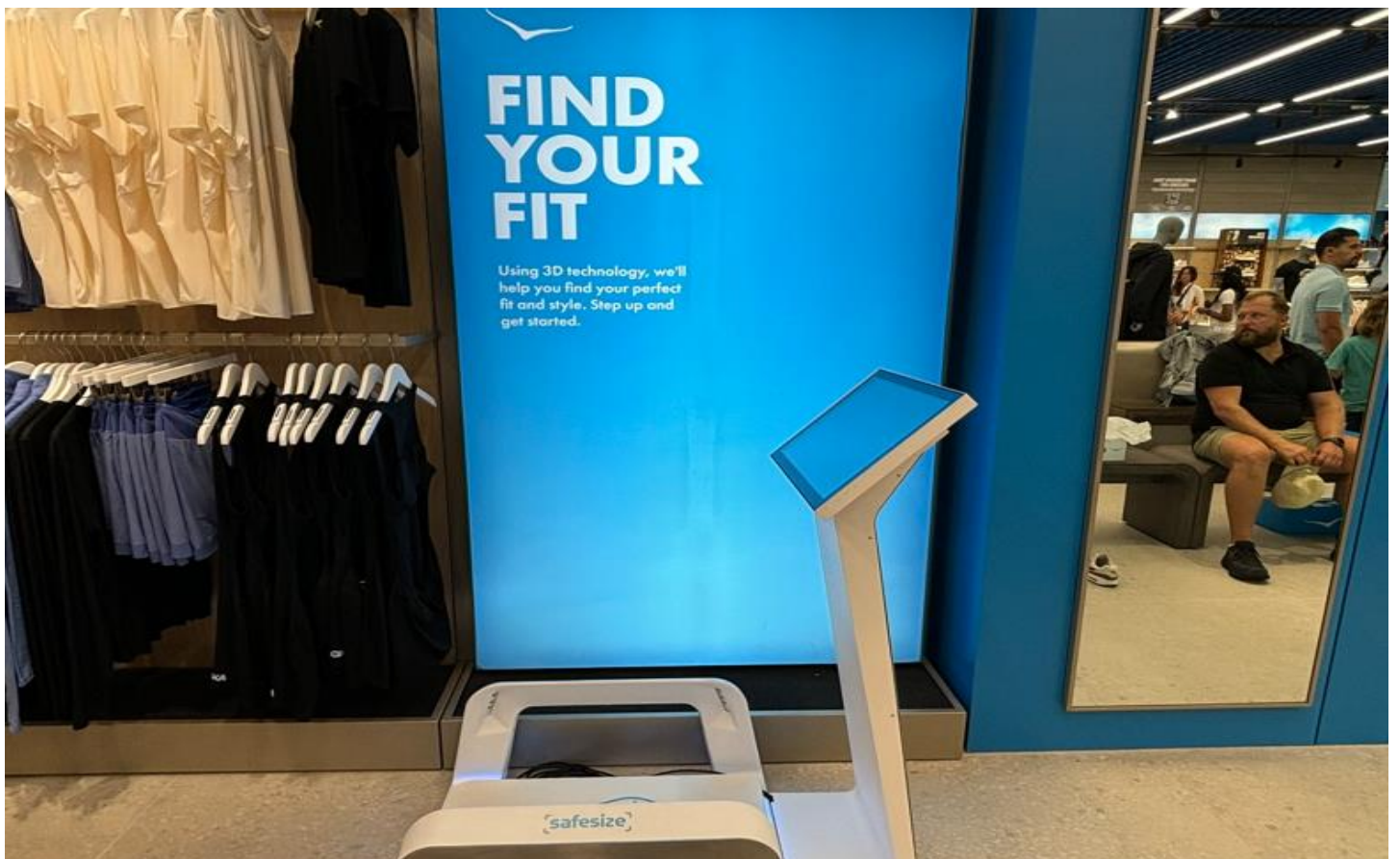
独自の3Dテクノロジーでぴったりなサイズのスニーカーを探すことができる