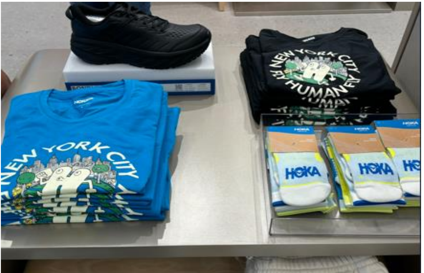
ニューヨーク本店のみのスペシャルアイテム