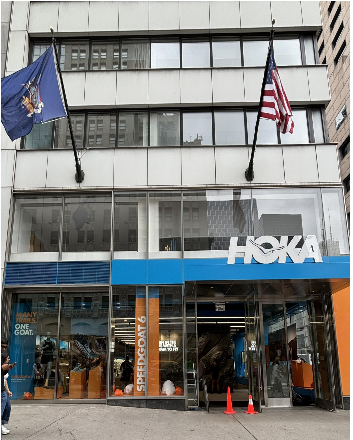
ナイキ、アディダスなどの旗艦店が並ぶ五番街にオープン