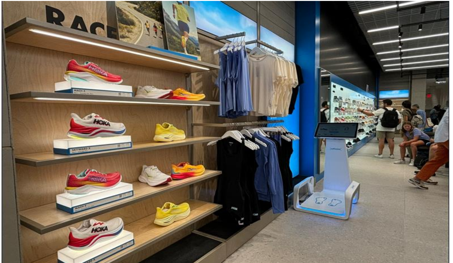
色ごとにディスプレイされたスニーカー