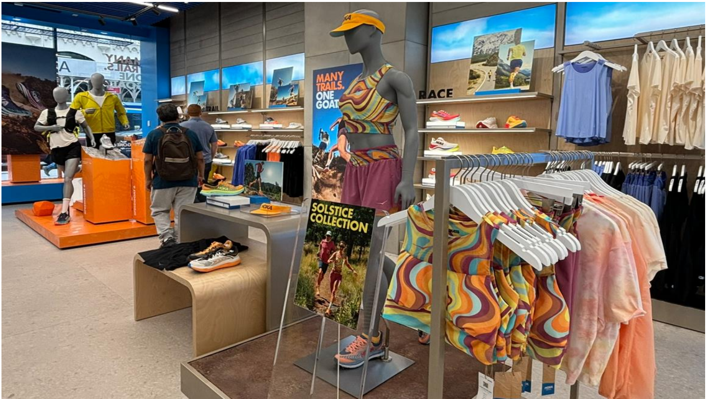
アパレルのラインナップも充実