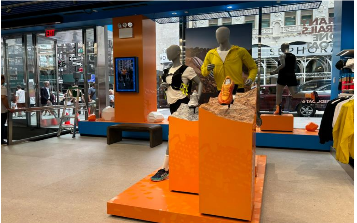
HOKA 特有のポップな色使いのインテリア